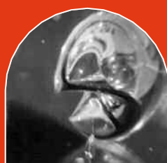
▲ EXPOSITION ANANDA DEL MICROCOSMO