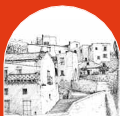
▲ EXPOSITION GERARD HURIET

par Anna Maria Angelini Chiarvetto Ananda : mot sanscrit qui signifie béatitude atteinte par la méditation et la contemplation. Contemplation du microcosme, cette moitié de l'univers quotidiennement sous nos yeux et pourtant invisible parce qu'elle n'est pas perceptible à l'œil humain, ou simplement négligée. Le mérite de l'artiste est de l'avoir transformée en images grâce à un simple appareil manuel, sans retouches ni élaborations digitales.