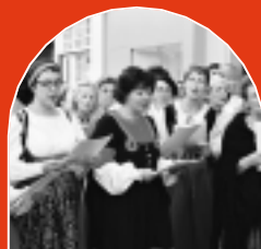
▲ NOTRE FÊTE DE LA MUSIQUE