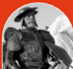
▲ DON QUICHOTTE