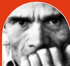
▲ PIER PAOLO PASOLINI