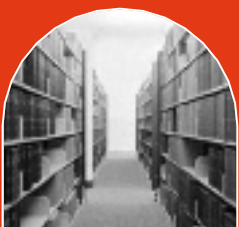
▲ BIBLIOTHÈQUE À FLORENCE