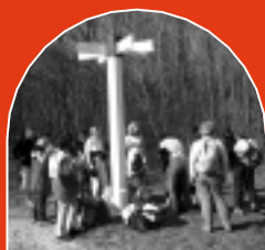
▲ PASSEGGIATA ITALIANA