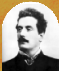
▲ GIACOMO PUCCINI