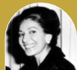
▲ MARIA CALLAS

LUNDI 20 JUIN Cycle Médée Table ronde - 2 e partie