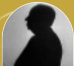
▲ ALFRED HITCHCOCK