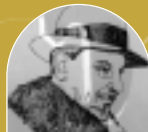
▲ LUIGI PIRANDELLO